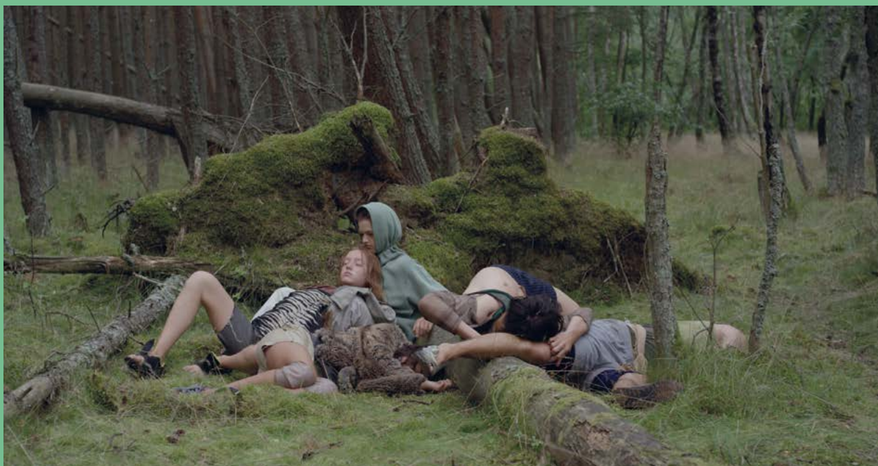
Songs from the Compost: Mutating bodies, imploding stars