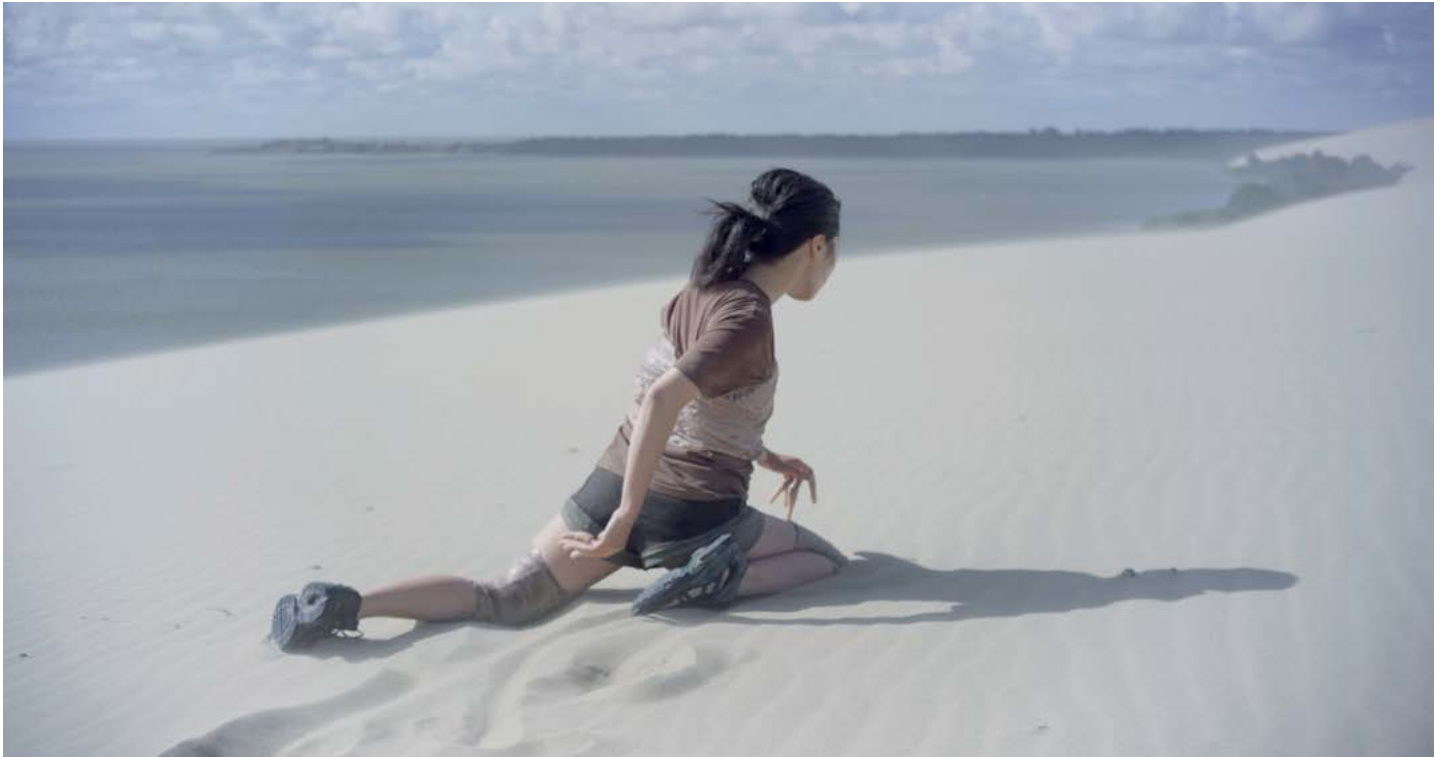
Songs from the Compost: Mutating bodies, imploding stars